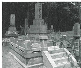
▲ 二岐共同墓地 (石碑の土台を修繕)

2か所とも風化が進んでいましたが、今年整備された石碑により、「開拓先人供養会」を執り行いました。