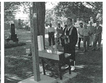
▲ 円山共同墓地 (石碑を建立)