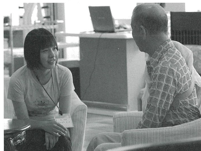
▲ガーデンハウスくりやま

栗山高校、継立中学校、一般の54名(延べ92名)がガーデンハウスくりやま・ハローENJOY・栗山いちい保育園・継立保育所・ワークセンター栗の木・配食サービス・ペットボトルキャップ選別作業の体験をしました。