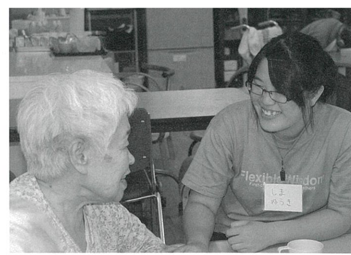
▲特別養護老人ホームくりのさと