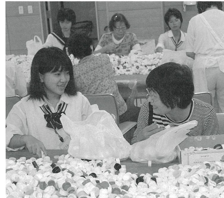
▲ペットボトルキャップ選別作業

栗山高校、継立・栗山中学校、一般の23名(延べ38名)が特別養護老人ホームくりのさと・ガーデンハウスくりやま・ハローENJOY・栗山いちい保育園・継立保育所・ワークセンター栗の木・配食サービス・ペットボトルキャップ選別作業の体験をいたしました。