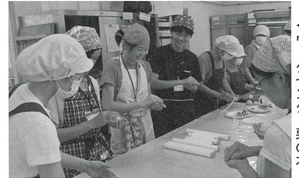
▲ワークセンター栗の木