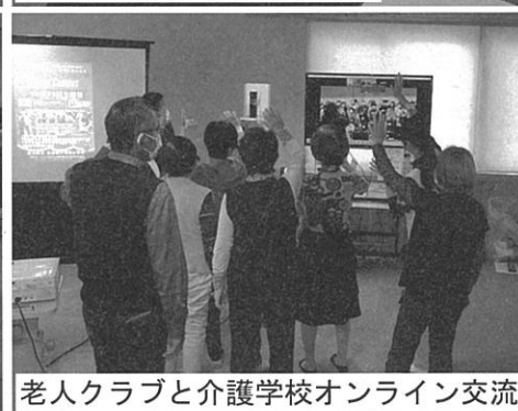
老人クラブと介護学校オンライン交流