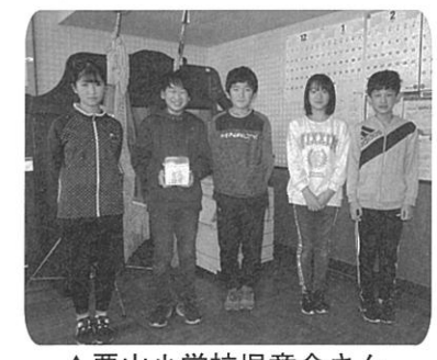
▲栗山小学校児童会さん