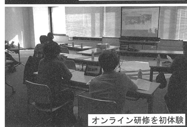
オンライン研修を初体験