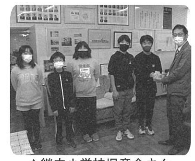
▲継立小学校児童会さん