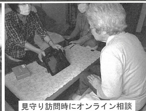
見守り訪問時にオンライン相談