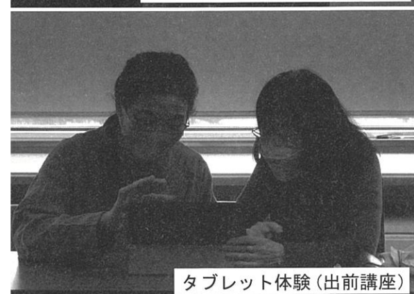
タブレット体験(出前講座)

団体や地域の集まり等で、タブレット体験の要望がありましたら、ご相談ください。社協職員がタブレットを持参して、お伺いいたします。お気軽にお声かけください。