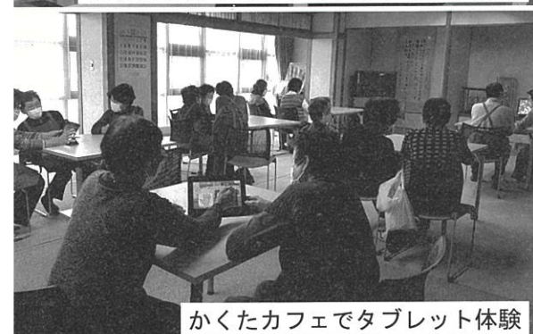
かくたカフェでタブレット体験