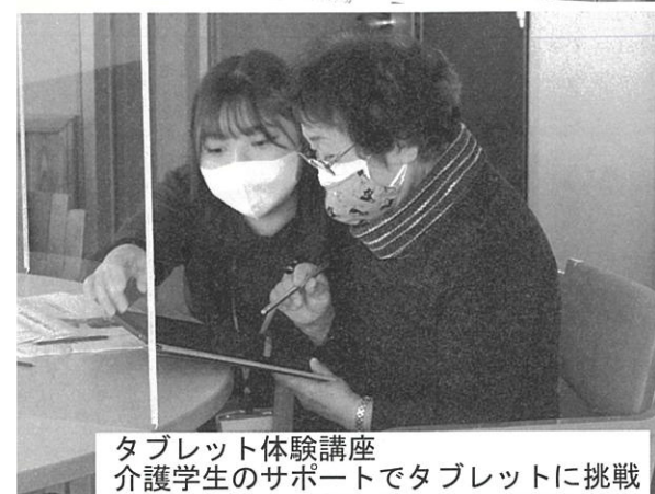
タブレット体験講座 介護学生のサポートでタブレットに挑戦