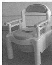
③【ポータブルトイレ】