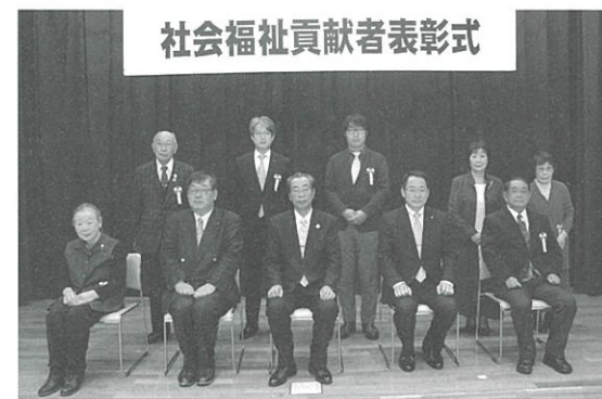
社会福祉貢献者表彰式