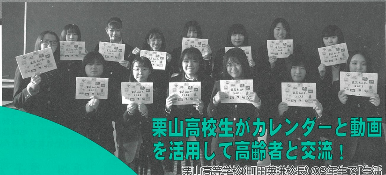
南町内会ふれあいサロン