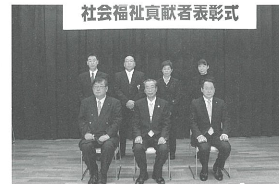
社会福祉貢献者表彰式