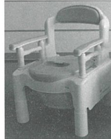
③【ポータブルトイレ】