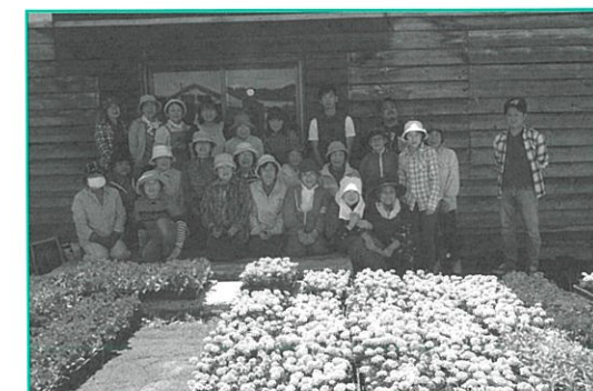
▲協力いただいたボランティアの皆さん