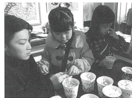
▲ガーデンハウス職員によるローソクづくり!