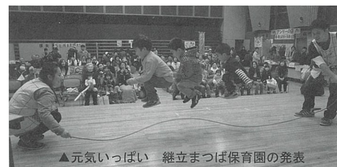
▲元気いっぱい 継立まつば保育園の発表