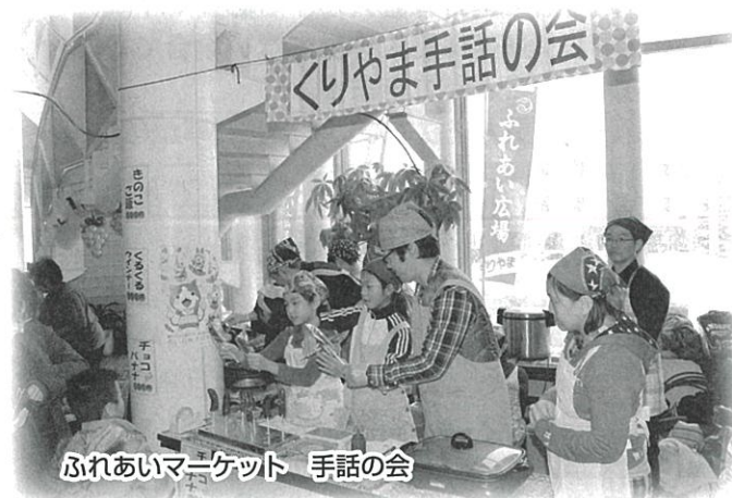
ふれあいマーケット 手話の会