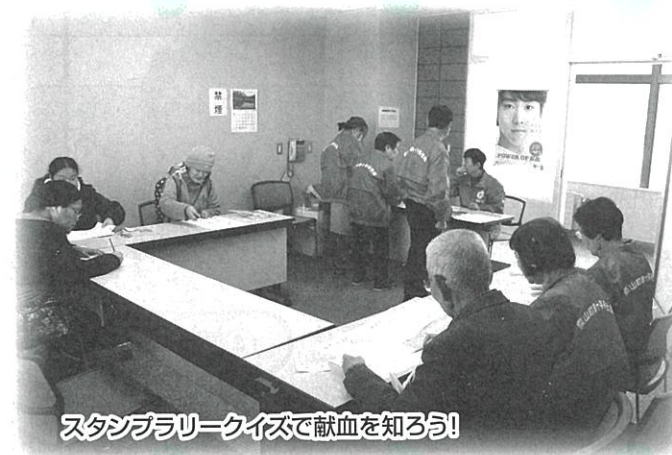
スタンブラークイズで献血を知ろう!