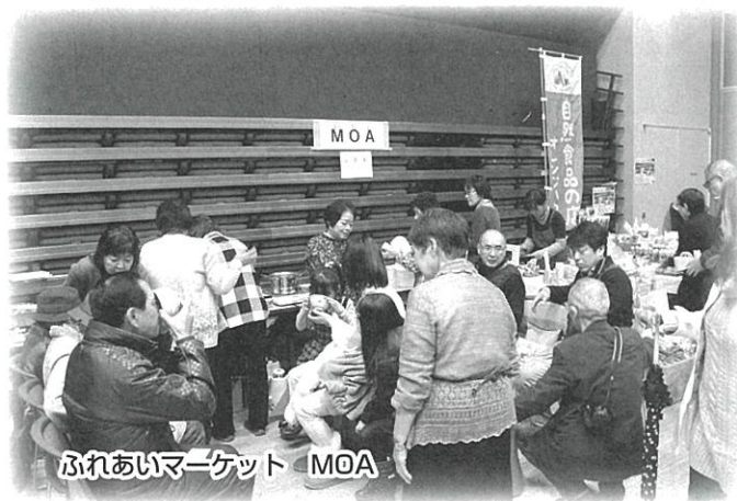
ふれあいマーケット MOA