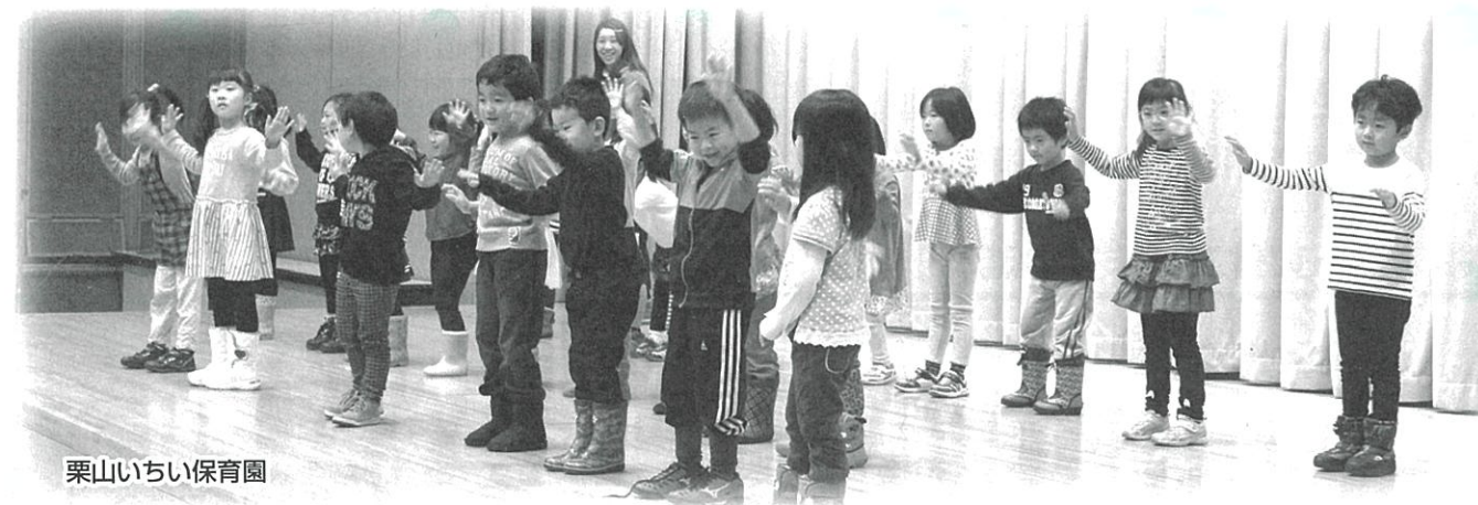
栗山いちい保育園