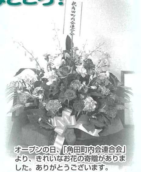
角田町内会連合会 オープンの日、「角田町内会連合会」より、きれいなお花の寄贈がありました。ありがとうございます。

※コーヒー・紅茶を飲まれる方は、事務室にて「飲み物券」を購入の上、会場にお越しください。会場に無料のお茶は用意しております。