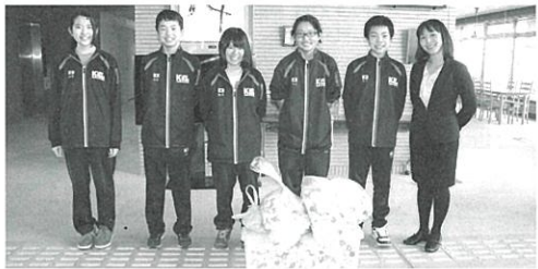
◀栗山中学校もペットボトルキャップ収集活動に取り組みされており、3月に寄付いただいております。