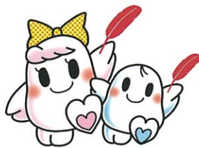
愛ちゃんと希望くん

と言いますが、最近では、東北・北関東における台風18号による大規模の被害、熊本県では阿蘇山の噴火など、被災地では、甚大な被害をもたらしている現状を目の当たりにし、改めて町の防災ガイドブックでハザードマップを確認しました。いざという時の準備をしっかりとしなければと非常用品のリストを確認しました。