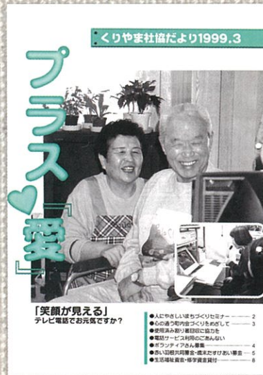
テレビ電話 (平成11年3月)