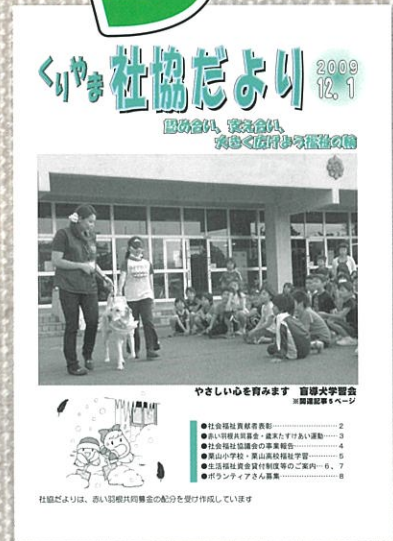
盲導犬学習会 (平成21年12月)