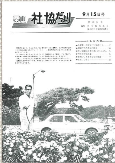
花いっぱい運動 (昭和54年9月)