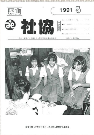
給食サービス(ボランティア) 栗高生が届ける (平成3年3月)